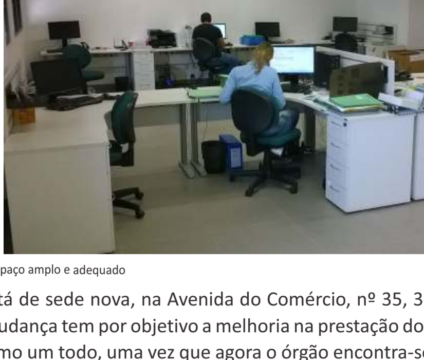
CAU/GO agora se encontra instalado em espaço amplo e adequado

Desde o último final de semana o CAU/GO está de sede nova, na Avenida do Comércio, nº 35, 3º andar, Edifício Concept Office, na Vila Maria José. A mudança tem por objetivo a melhoria na prestação dos serviços aos arquitetos e urbanistas e à sociedade como um todo, uma vez que agora o órgão encontra-se instalado em espaço amplo e adequado, com melhor estrutura para seu funcionamento.