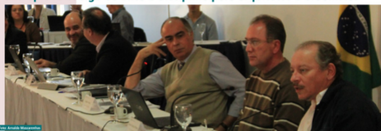
Reunião Plenária do Conselho aprovando o Código de Ética da arquitetura e do urbanismo que entrará em vigor em setembro

O Código de Ética e Disciplina para os arquitetos e urbanistas foi aprovado durante a 21ª Reunião Plenária do Conselho de Arquitetura e Urbanismo do Brasil (CAU/BR). A homologação da norma está prevista para os dias 5 e 6 de setembro. O documento será amplamente divulgado para os profissionais e sociedade. Este é o primeiro Código de Ética e Disciplina específico para os arquitetos e urbanistas editado no Brasil e será um instrumento de valorização da profissão.