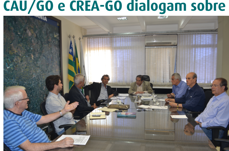
Representantes dos conselhos falam sobre as atribuições. Ao final, presidente do CAU/GO é presenteado pelo CREA-GO