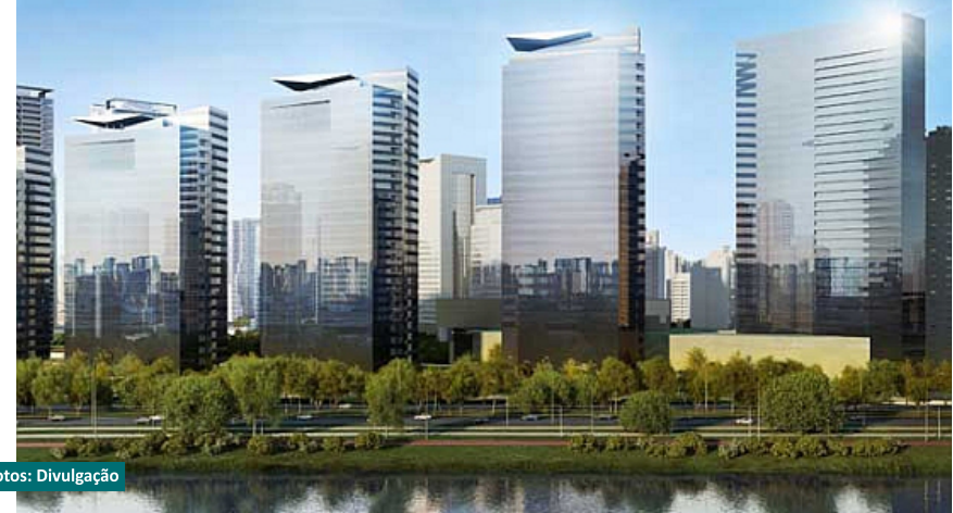
Parque da Cidade, em São Paulo