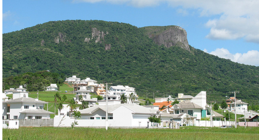
Pedra Branca Cidade, em Palhoça, Santa Catarina

Em ranking elaborado pelo Climate Positive Development Program, iniciativa da Fundação Clinton e do U.S. Green Building Council, dois empreendimentos brasileiros foram escolhidos entre os 18 projetos mais sustentáveis do mundo. São eles: Parque da Cidade, em São Paulo, e Pedra Branca Cidade, situado em Palhoça, em Santa Catarina. Considerado referência internacional de desenvolvimento urbano e redução da emissão de CO2, o megacomplexo paulista, desenvolvido pela Odebrecht e situado no bairro do Brooklin, conta com prédios residenciais, comerciais, shopping e hotel.