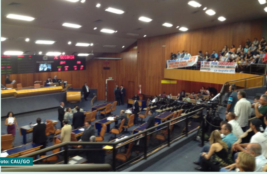
Votación do projeto que altera o Plano Diretor, na Câmara de Vereadores

Nos últimos dias foram realizadas audiência pública (dia 11), votação (16) e reunião da Comissão Mista da Câmara de Vereadores (18) a respeito do Plano Diretor de Goiânia. O CAU vem participando de todas as ações sobre este tema. A audiência pública foi realizada com a presença de várias entidades, que pediram estudos mais detalhados sobre os pontos a serem alterados. Mesmo com esta ressalva, o plenário da Câmara realizou primeira votação, na terça-feira, do projeto. Do texto original enviado pelo Paço apenas uma emenda foi aprovada, que é a que permite templos religiosos construírem estacionamentos verticais gratuitos. Todos os outros pontos foram reprovados.