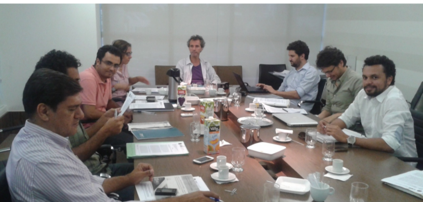
Reunião Plenária do CAU/GO é realizada na sede do Conselho

Foi realizada na última quinta-feira (04) a 15ª Reunião Plenária do CAU/GO. Foram colocados em pauta assuntos como a fiscalização, os relatos do Grupo de Trabalho da sede definitiva do CAU Goiás, das comissões de ensino e formação; ética e exercício profissional; e administração e finanças, bem como foi apresentado o cronograma de eventos 2013. Os conselheiros que representaram o CAU/GO em reuniões e eventos de interesse da arquitetura e urbanismo informaram sobre suas participações.