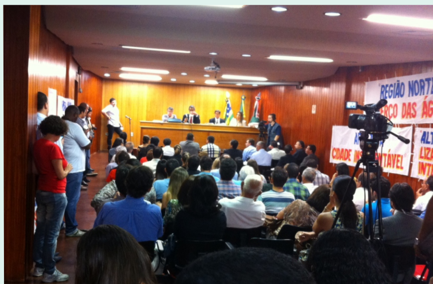
Audiência Pública na Câmara de Vereadores sobre Plano Diretor

O Conselho de Arquitetura e Urbanismo de Goiás (CAU/GO) participou na manhã desta sexta-feira (05) da audiência pública realizada na Câmara de Vereadores de Goiânia para discutir as alterações no Plano Diretor. Participaram do evento ainda outras entidades profissionais, órgãos municipais e sociedade civil organizada. Foram debatidos os pontos mais polêmicos do projeto como os polos industriais, mobilidade, criação de novos eixos de transposição, habitação, adensamento e a proteção dos mananciais de abastecimento. Com tantos temas a serem analisados os vereadores solicitaram que sejam realizadas outras audiências públicas para tratar de pontos específicos do plano.