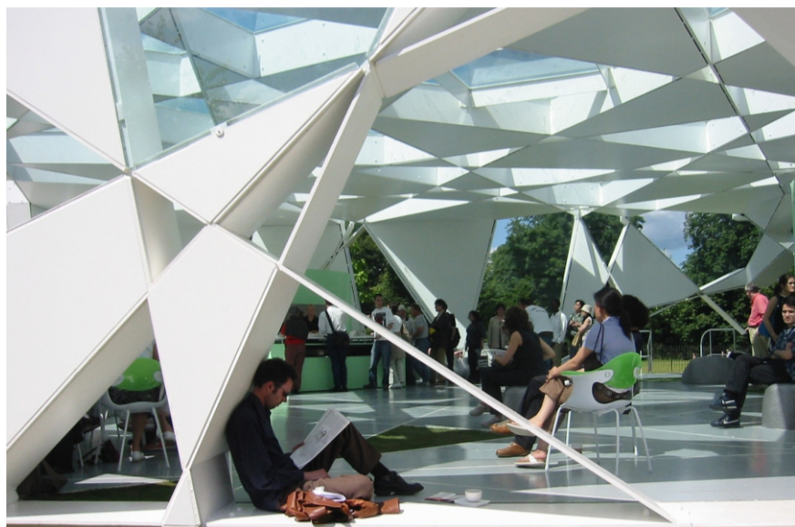
Toyo Ito (esq.) recebendo o Prêmio Pritzker no dia 17 de março. Ao lado, uma de suas obras, construída em Londres (Inglaterra)

O japonês Toyo Ito foi agraciado no último dia 17 com o Prêmio Pritzker de Arquitetura 2013 por uma obra ‘que combina inovação conceitual com edifícios soberbamente executados’, por uma arquitetura ‘excepcional’ e pela ‘dimensão espiritual e poética que transcende de todas suas obras’. Aos 71 anos, o arquiteto e urbanista japonês é tido como ‘um criador de edifícios atemporais, com os quais sempre propõe novos caminhos. Sua arquitetura projeta um ar de otimismo, leveza e alegria, e está impregnada de um sentido de unicidade e universalidade’, segundo as considerações do júri, presidido pelo lorde Peter Palumbo. Ao longo de mais de 40 anos de carreira, Ito deu vida a bibliotecas, casas, parques, teatros, lojas, edifícios de escritórios e pavilhões, como o Necrotério de Gifu (2006), a Biblioteca Universitária Tama Art de Tóquio (2007) e o Pavilhão da Serpentine Gallery em Londres (2002).