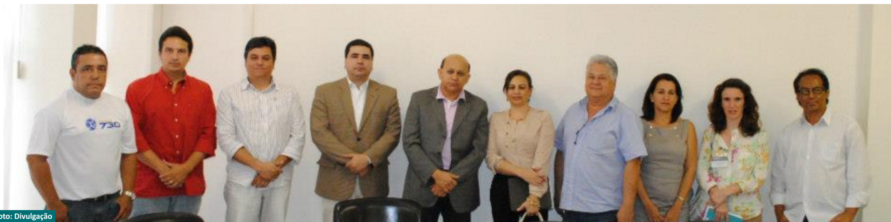
Representantes das entidades presentes na audiência pública promovida na Câmara de Vereadores para tratar da segurança nas boates

Foi realizada na última segunda-feira, audiência pública com representantes da Associação de Bares, Restaurantes e Similares (Abrasel), Agência Municipal do Meio Ambiente (Amma), Secretaria Municipal de Desenvolvimento Urbano Sustentável, Secretaria Municipal de Fiscalização, Secretaria de Defesa Social, Sindicato dos Músicos e Conselho de Arquitetura e Urbanismo de Goiás (CAU/GO). A audiência teve como objetivo tratar da situação das boates e casas de eventos que funcionam em Goiânia.