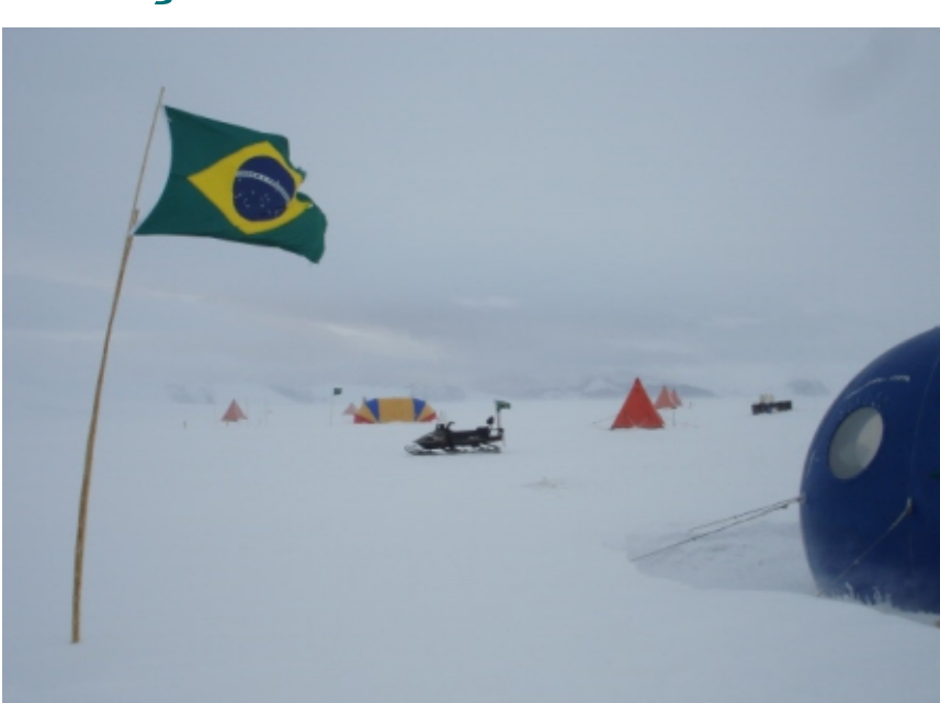
Acampamento da expedição de cientistas brasileiros na Antártica

O caráter internacional do concurso tem a intenção de promover um intercâmbio de conhecimento, estimular inovações e incorporar avançados requisitos tecnológicos ao projeto.