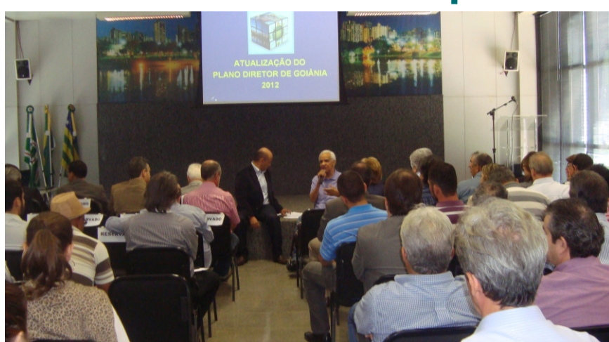
Audiência sobre o projeto que Altera o Plano Diretor de Goiânia realizada no dia 23 de novembro de 2012, no Paço Municipal

Surpreendentemente, na tarde do dia 29 de dezembro, a Lei Complementar 171/2007 foi aprovada em segunda votação. O envio da matéria no “apagar das luzes” de 2012 pegou de surpresa até os vereadores da base aliada do prefeito de Goiânia, que acreditavam que esta pauta voltaria somente em 2013. O projeto agora está nas mãos do prefeito para ser sancionado.