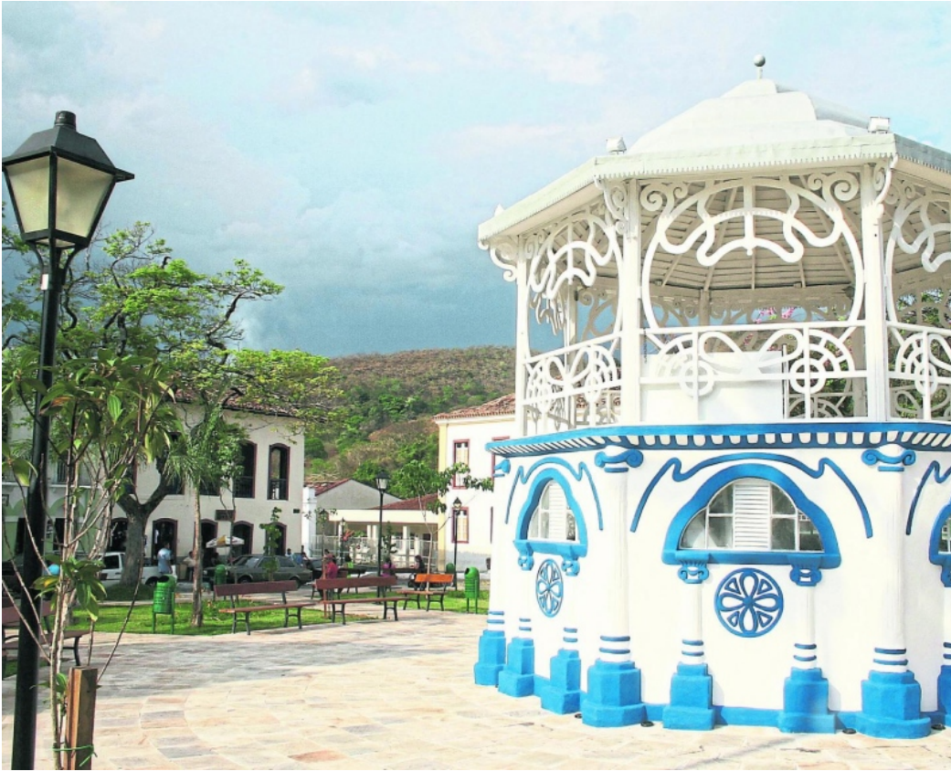
Coreto da Cidade de Goiás é um dos ícones da antiga capital